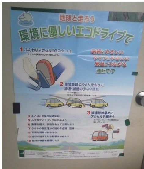
エコドライブの励行明示貼付