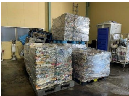
関連施設 (佃リサイクルセンター)