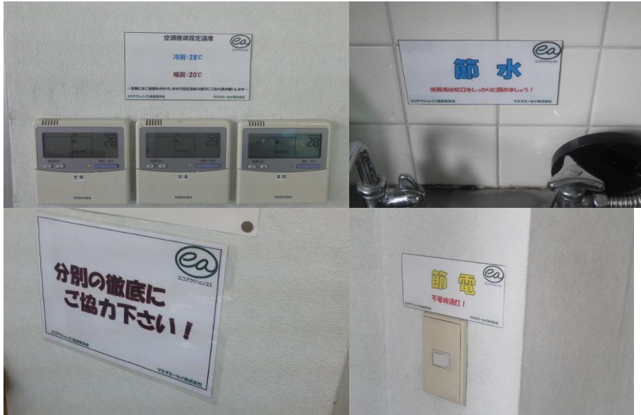
関連施設へのエコアクション活動励行の明示貼