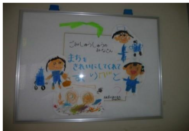
取引先様からの感謝のお気持ち