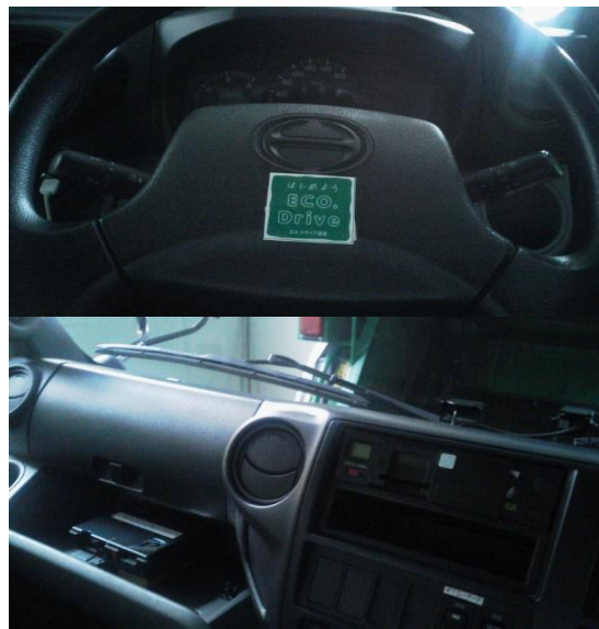
作業車全車にドライブレコーダー・デジタコを設置