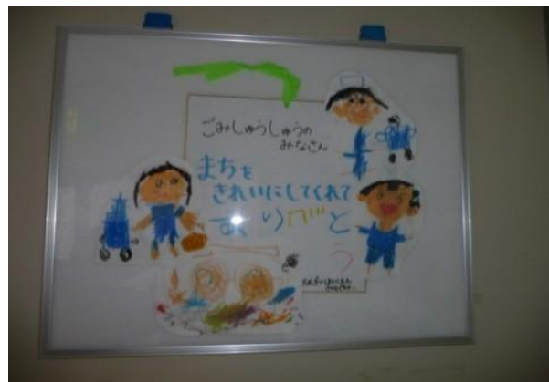
取引先様からの感謝のお気持ち