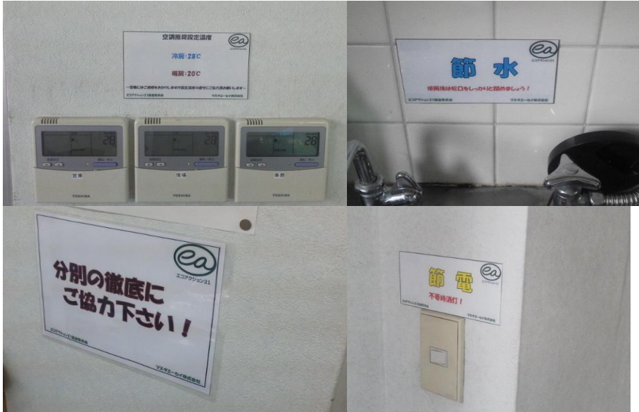
関連施設へのエコアクション活動励行の明示貼